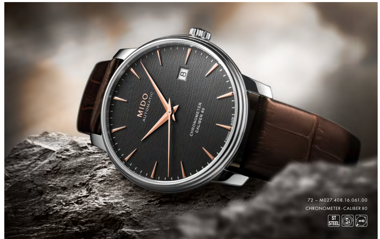
72 - M027.408.16.061.00 CHRONOMETER - CALIBER 80