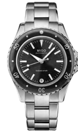
2 - M026.207.11.051.00 CALIBER 80