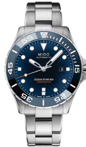
16 - M026.608.11.041.01 CHRONOMETER - CALIBER 80