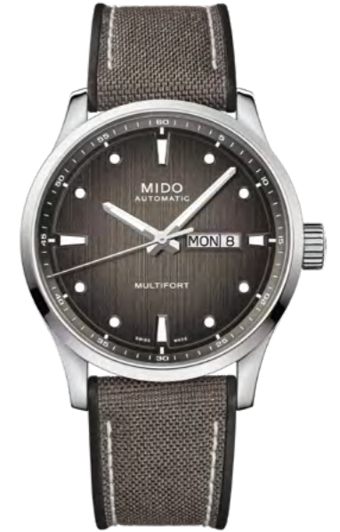
20 - M038.430.17.081.00 CALIBER 80