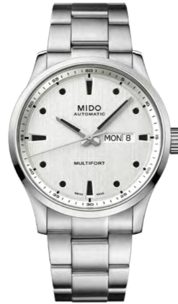
18 - M038.430.11.031.00 CALIBER 80

미도는 오리지널 세로 새틴 마감 다이얼에 멀티포트의 새로운 모멘텀에 대한 강렬한 미학을 제공합니다. 과감한 디자인은 견고한 하이테크 메커니즘과 정교하게 조화를 이룹니다.