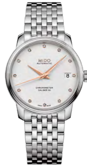
69 - M027.208.11.036.00 CHRONOMETER - CALIBER 80

품격과 정확성을 결합한 시계를 위해 군더더기 없이 깔끔한 라인과 최첨단 기술이 결합되었습니다. 바론첼리 크로노미터 실리콘 모델은 슬레트에서 영감을 얻은 독보적인 패턴이 특징입니다.