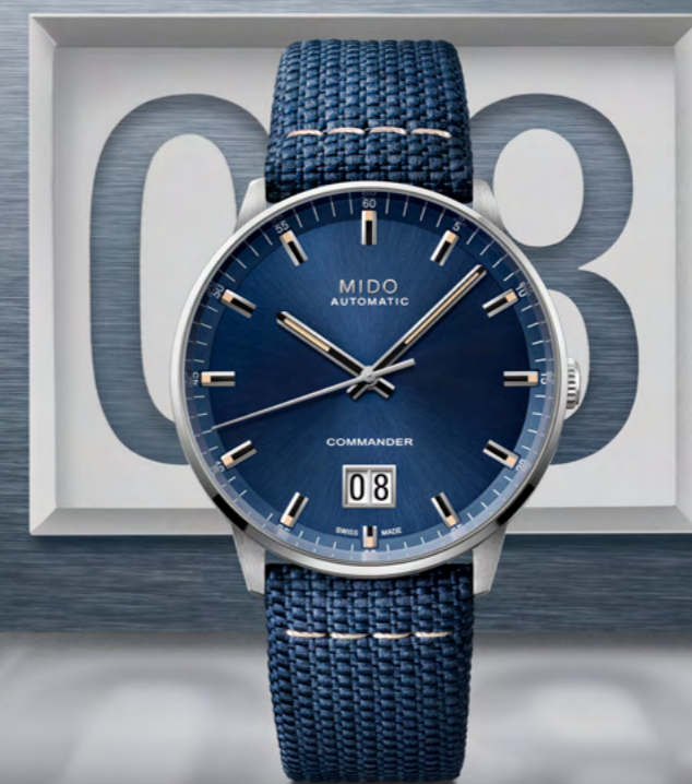
59 - M021.626.17.041.00 CALIBER 80