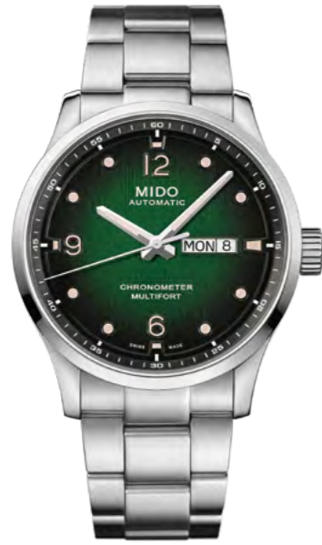
22 - M038.431.11.097.00 CHRONOMETER - CALIBER 80

위치메이킹 기술에의 정통함을 완벽하게 구현하는 미도에서는 스위스 공식 크로노미터 테스트 기관인 COSC(Contrôle Officiel Suisse des Chronomètres) 인증을 받은 실리콘 밸런스 스프링 무브먼트의 멀티포트 M 크로노미터를 선보입니다. 이 모델은 표준을 뛰어넘는 뛰어난 품질의 제품을 자랑합니다.