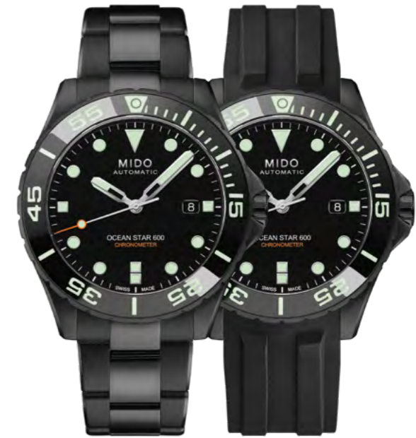
17 - M026.608.33.051.00 CHRONOMETER - CALIBER 80