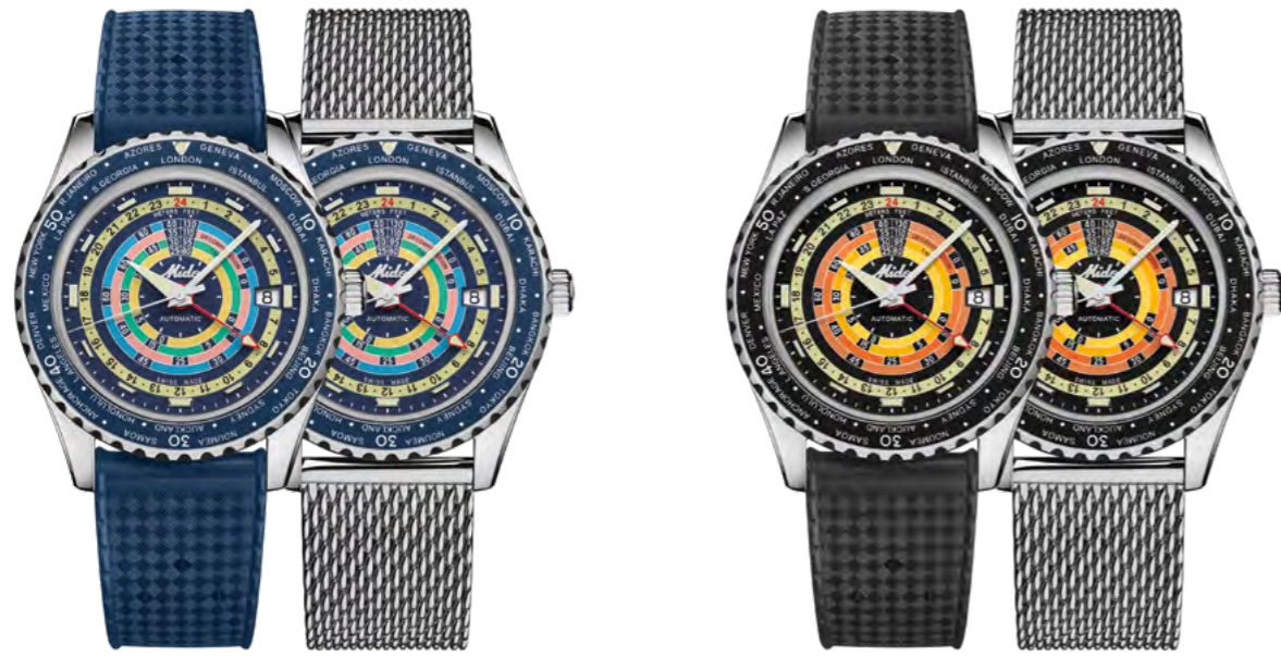
4 - M026.829.17.041.00 CALIBER 80