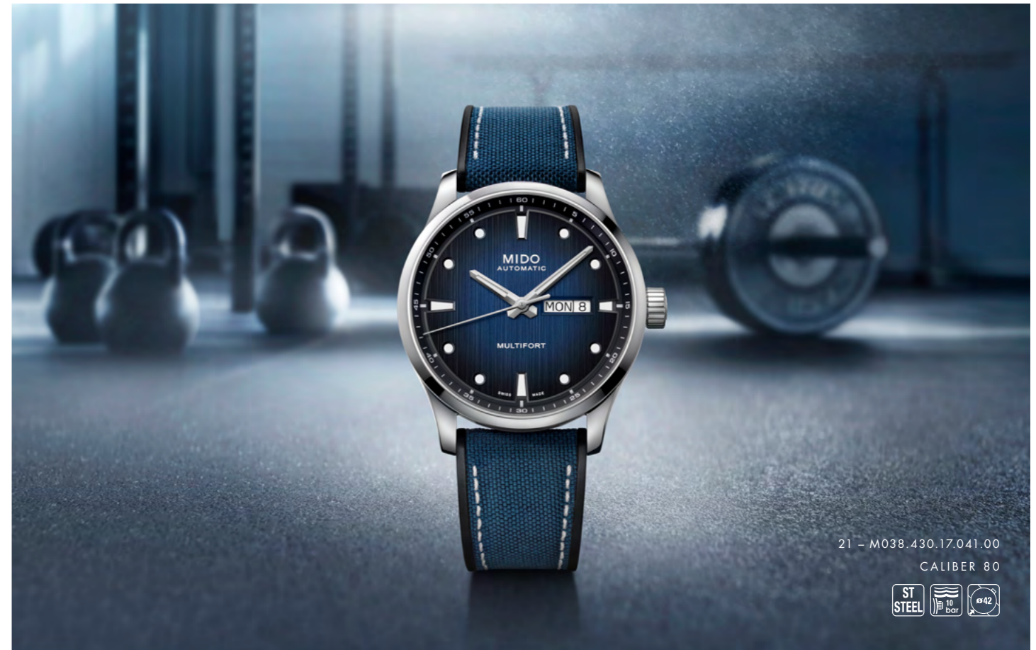
21 - M038.430.17.041.00 CALIBER 80