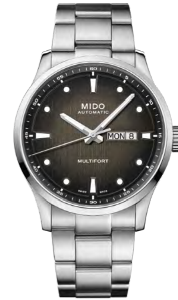
19 - M038.430.11.051.00 CALIBER 80