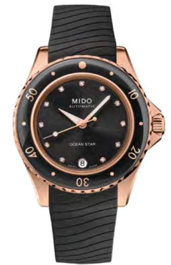
3 - M026.207.37.056.00 CALIBER 80