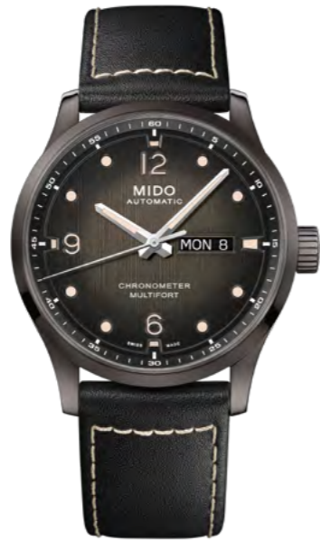
23 - M038.431.36.057.00 CHRONOMETER - CALIBER 80