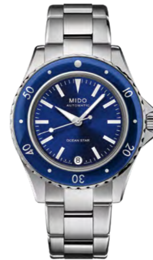
1 - M026.207.11.041.00 CALIBER 80

미도에서는 모든 손목에 잘 맞는 새로운 직경의 오션 스타 36.5를 선보입니다. 1960년대에서 영감을 얻은 스포티하면서 시크한 다이버 시계인 오션 스타 36.5는 대담한 모험가와 야외 활동을 즐기는 이들을 위한 시계입니다.