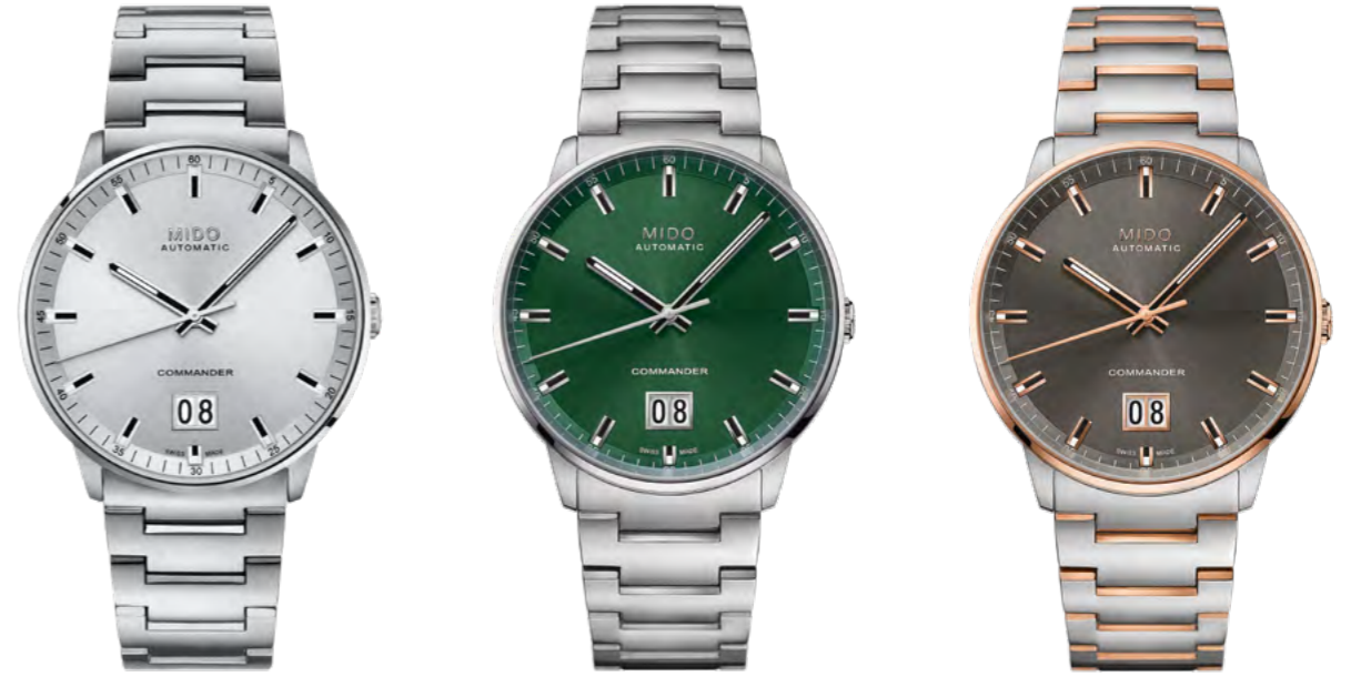
56 - M021.626.11.031.00 CALIBER 80

미도는 커맨더 빅 데이트 컬렉션을 통해 낙관적이고 대담한 생각을 품고 앞으로 나아가자는 메시지를 전달합니다. 컬렉션을 대표하는 특징인 날짜 표시창은 정각 6시 방향에 위치해 있으며, 큼직한 크기로 뛰어난 가독성을 제공합니다.