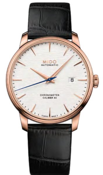
71 - M027.408.36.031.00 CHRONOMETER - CALIBER 80