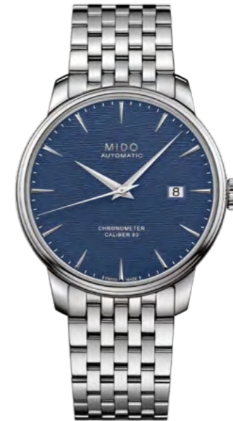
70 - M027.408.11.041.00 CHRONOMETER - CALIBER 80