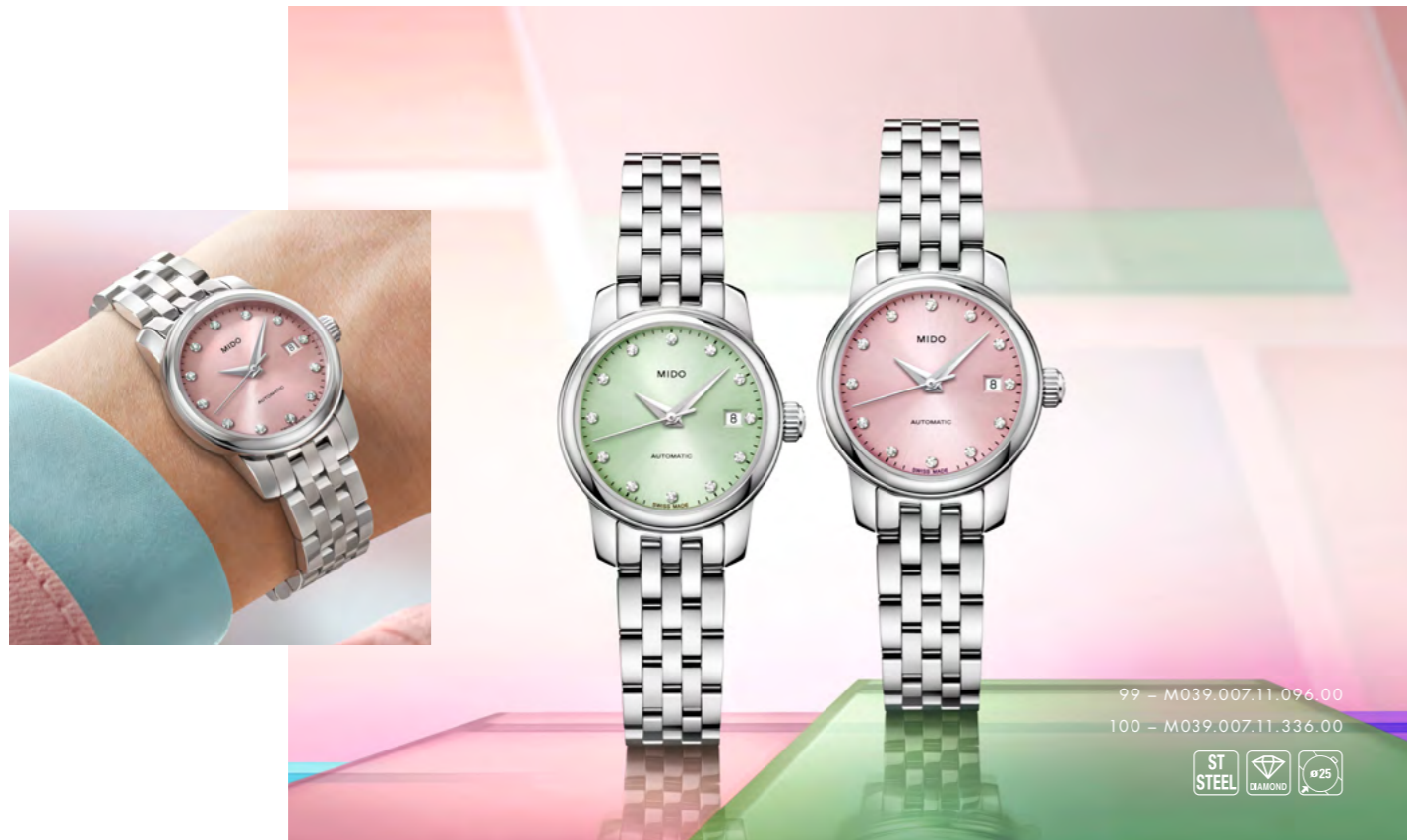
99 - M039.007.11.096.00