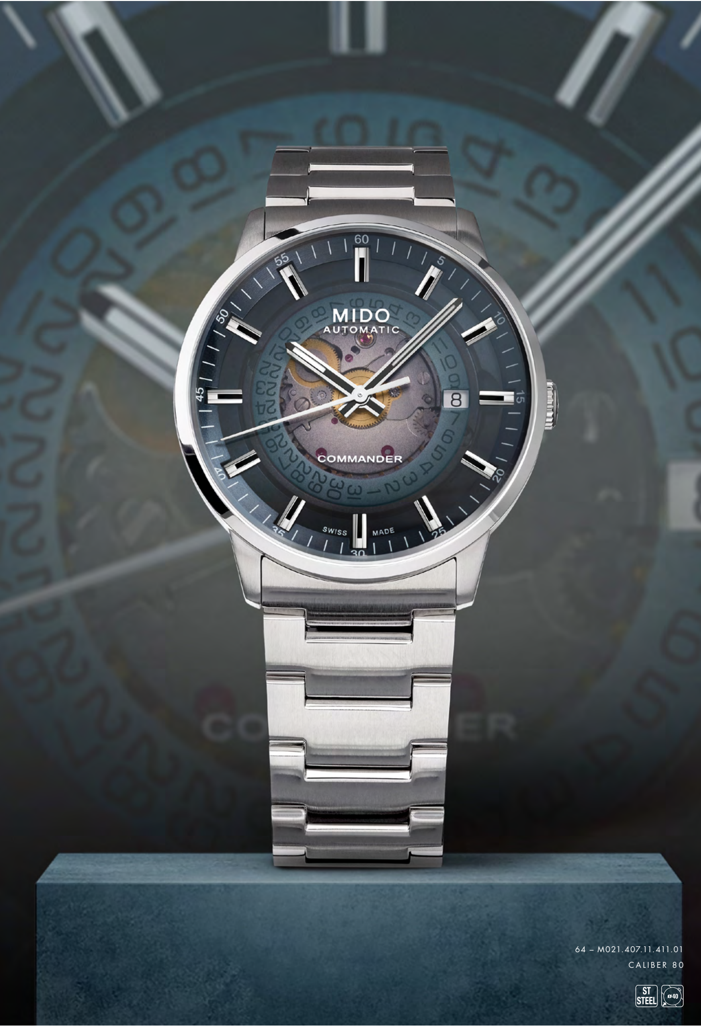
64 – M021.407.11.411.01 CALIBER 80