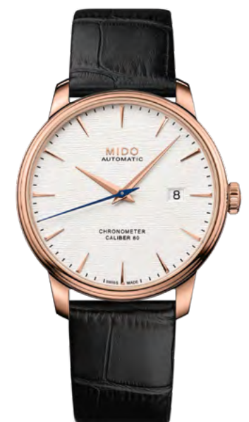
71 – M027.408.36.031.00 CHRONOMETER-CALIBER 80