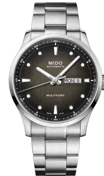
19 – M038.430.11.051.00 CALIBER 80