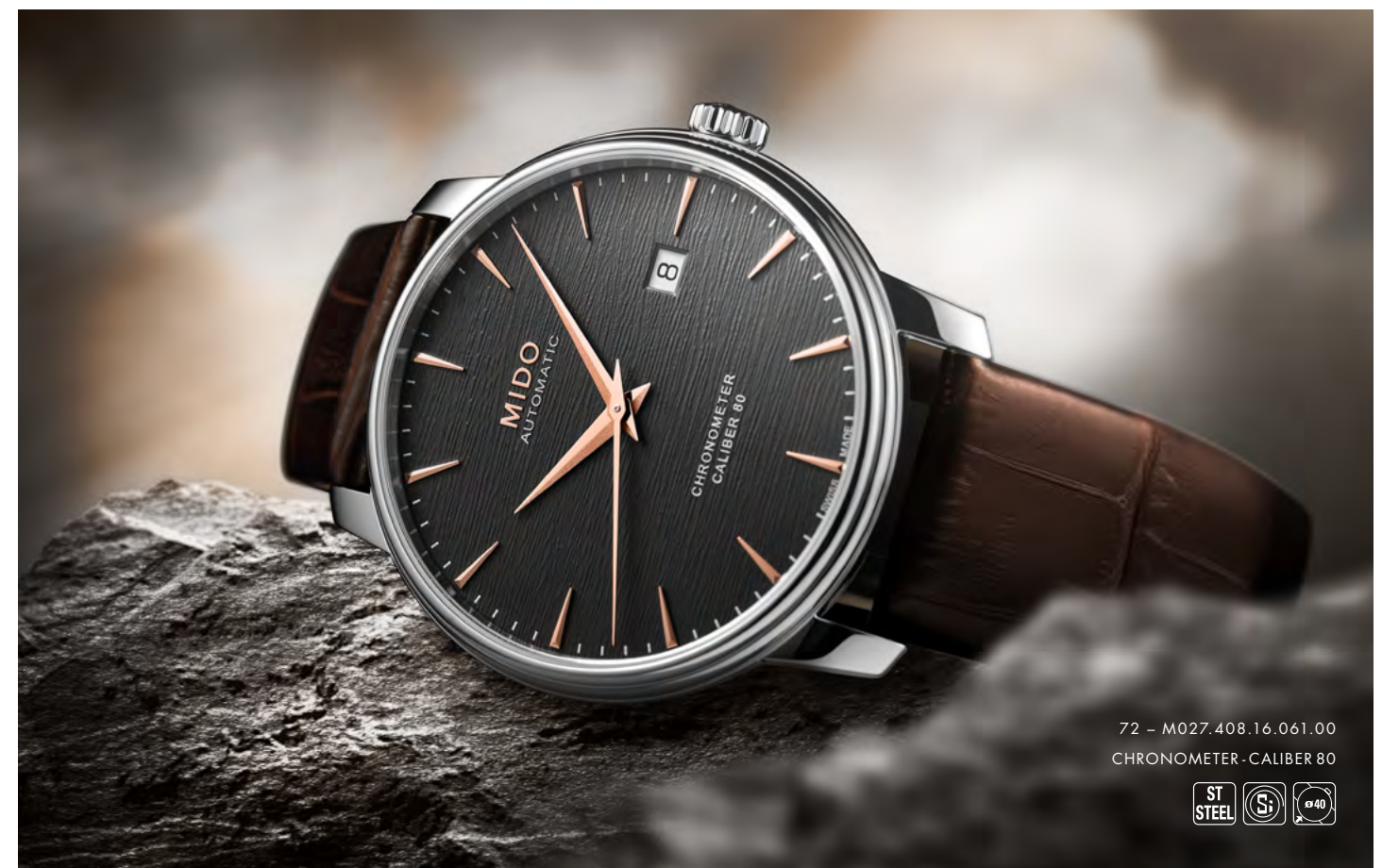
72 – M027.408.16.061.00 CHRONOMETER-CALIBER 80