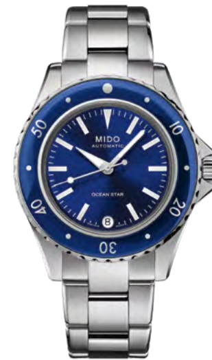
1 – M026.207.11.041.00 CALIBER 80

MIDO präsentiert die faszinierende Ocean Star 36.5 in neuem Durchmesser, passend für jedes Handgelenk. Diese von den Sechzigerjahren inspirierte, sportlich-schicke Taucheruhr ist für Abenteuerer genauso gemacht wie für Sonnenanbeter, die auch am Strand auf Stil achten.