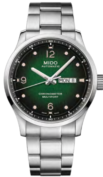
22 – M038.431.11.097.00 CHRONOMETER – CALIBER 80

Der Multifort M Chronometer ist der perfekte Ausdruck uhrmacherischen Könnens. Sein Uhrwerk mit Siliziumspiralfeder ist von der COSC (Contrôle Officiel Suisse des Chronomètres – offizielle Schweizer Chronometerprüfstelle) geprüft und zertifiziert. Dieses Modell zeichnet sich durch eine außergewöhnliche Qualität aus, die die Standards weit übertrifft.