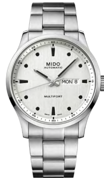
18 – M038.430.11.031.00 CALIBER 80

MIDO verleiht der kraftvollen Ästhetik der Multifort eine neue Dynamik: mit einem unkonventionellen, vertikal satinierten Zifferblatt. Ein markanter Look, meisterhaft kombiniert mit einem robusten Hightech-Werk.