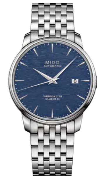
70 – M027.408.11.041.00 CHRONOMETER-CALIBER 80