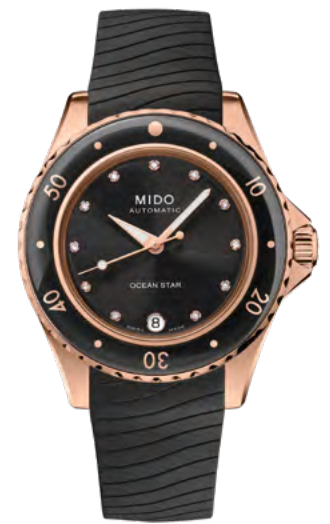
3 – M026.207.37.056.00 CALIBER 80