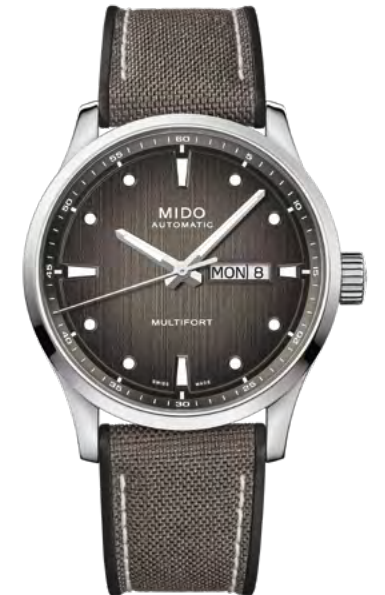
20 – M038.430.17.081.00 CALIBER 80