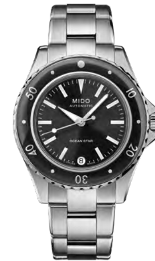
2 – M026.207.11.051.00 CALIBER 80