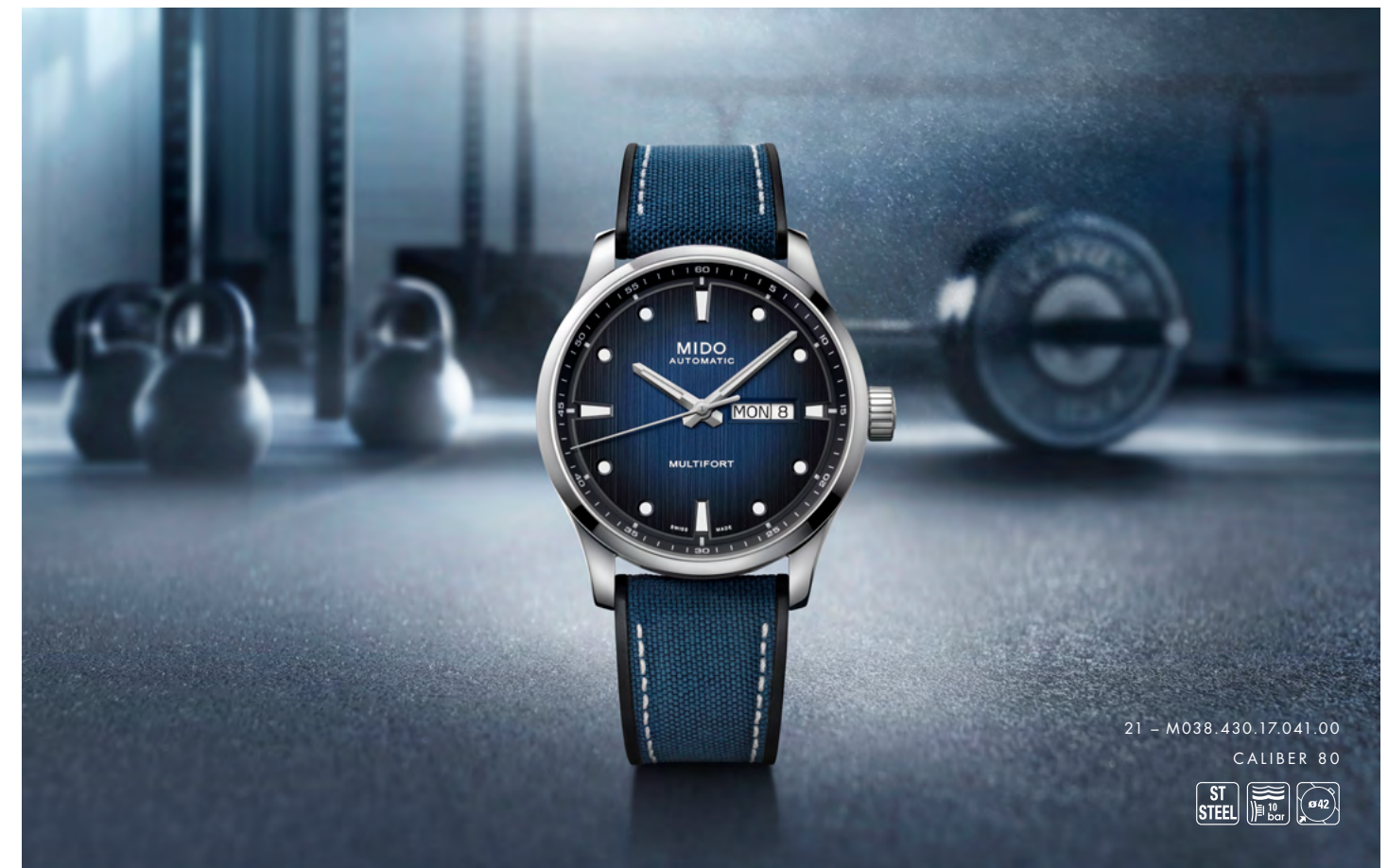
21 – M038.430.17.041.00 CALIBER 80