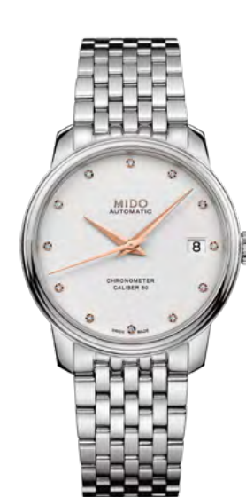
69 – M027.208.11.036.00 CHRONOMETER-CALIBER 80

Klare Linien und hochmoderne Technologien für einen Zeitmesser, der Eleganz und Präzision vereint. Die Modelle der Linie Baroncelli Chronometer Silicon verfügen über ein prachtvolles Zifferblatt, dessen Muster von Schiefer inspiriert ist.