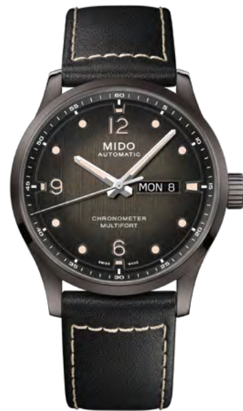
23 – M038.431.36.057.00 CHRONOMETER – CALIBER 80